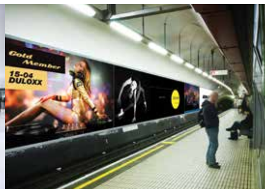
Comunicazione esterna - vinile