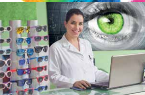
Comunicazione nel punto vendita – carta