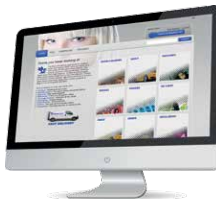
Software de impresión vía web StoreFront

L'interfaccia utente (GUI) di Asanti offre una semplice visualizzazione del layout dei lavori: gli operatori possono visualizzare esattamente ciò che stanno stampando. La GUI garantisce l'accesso ai parametri di stampa per assicurarsi che tutti i cambiamenti dell'ultimo minuto siano veloci e facili da applicare. Grazie all'infrastruttura client-server, è possibile preparare i lavori indipendentemente dal fatto che Anapurna sia in funzione. Questa automazione rende la stampante autonoma e non costringe l'operatore a dover presenziare costantemente quando altre operazioni richiedono la sua attenzione.