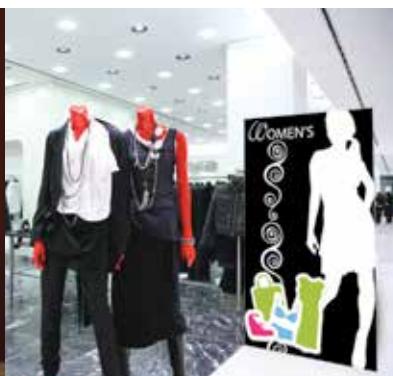
Comunicazione all'interno del punto vendita - forex