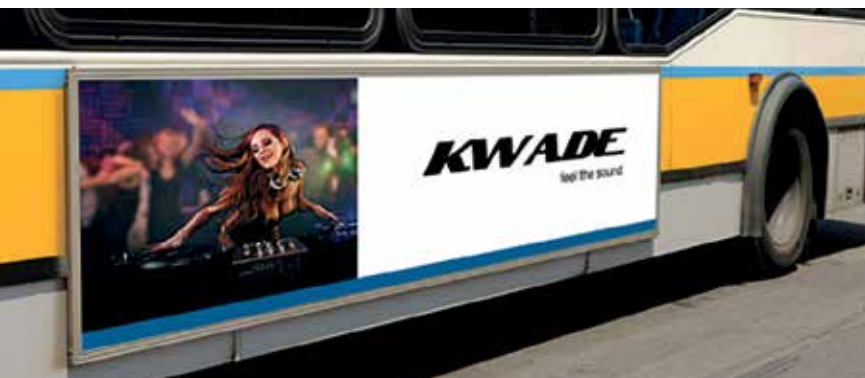
Comunicazione esterna - vinile