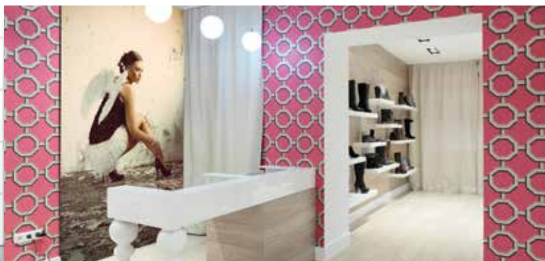
Comunicazione all'interno del punto vendita - forex