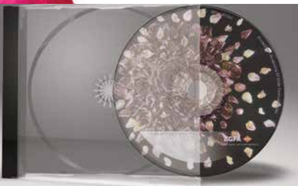
Stampa su oggetti