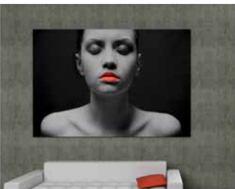
Decorazione domestica - dibond

Anapurna FB2540i LED, in abbinamento ad Asanti, si integra perfettamente anche con PrintSphere, il servizio cloud di Agfa Graphics progettato per automatizzare la produzione, semplificare la condivisione dei file e archiviare i dati in tutta sicurezza. Questo servizio cloud integrabile offre un metodo standardizzato per automatizzare il flusso dei dati e semplificarne lo scambio con clienti, colleghi, freelance, altri reparti e altre soluzioni Agfa.