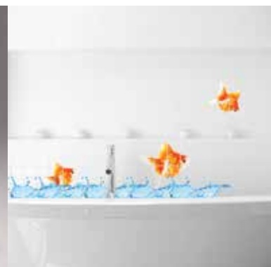
Stampa su piastrelle