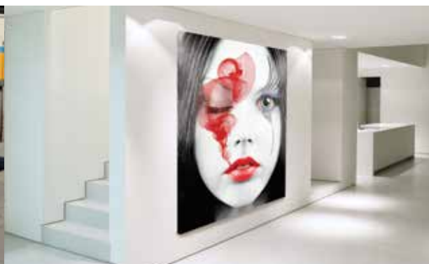
Comunicazione domestica - dibond