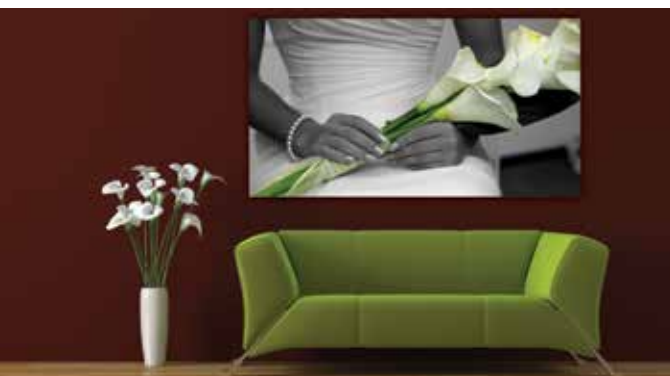
Decorazione domestica - dibond