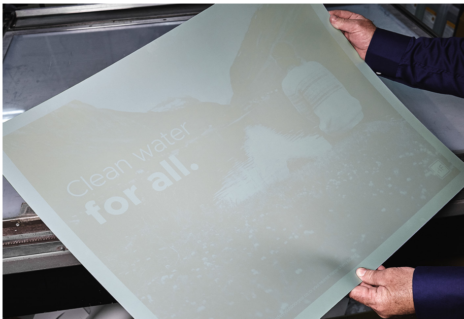
Il sistema CTP TRENDSETTER Q400/Q800 è totalmente compatibile con le lastre SONORA Process Free.

La nuova app per il controllo mobile dei sistemi CTP KODAK opzionale consente di monitorare il sistema CTP TRENDSETTER Q400/Q800 in remoto da un dispositivo Android o IOS. Questo significa che, anche quando non si è in sede o nella sala operativa, è possibile rendersi immediatamente conto se uno dei sistemi CTP richiede l'intervento dell'operatore e agire prontamente per riprendere la produzione delle lastre in tempi rapidi.